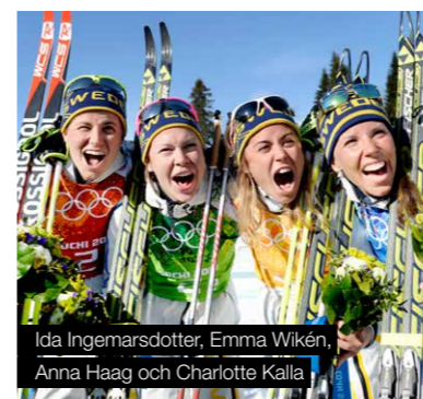
Ida Ingemarsdotter, Emma Wikén, Anna Haag och Charlotte Kalla