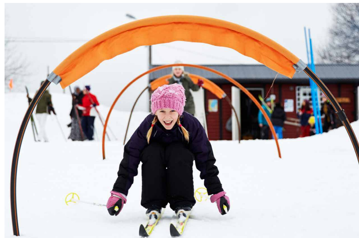
Skidlekpark i Sundsvall

Ida Ingemarsdotter, Emma Wikén, Anna Haag och Charlotte Kalla gjorde det ingen trodde var möjligt. Kvartetten vann guld, det första damstafettguld i OS sedan 1960.