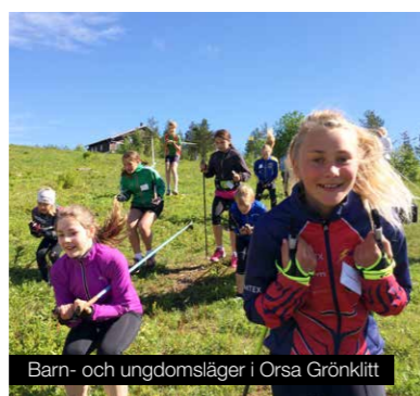
Barn- och ungdomsläger i Orsa Grönklitt